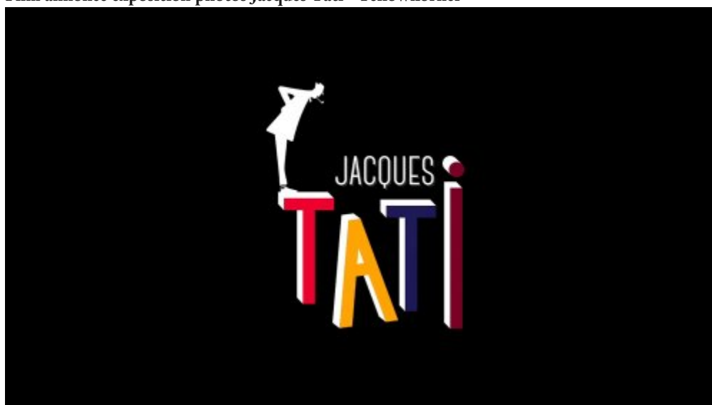
Film annonce exposition photos Jacques Tati - Yellowkorn (MPEG4)